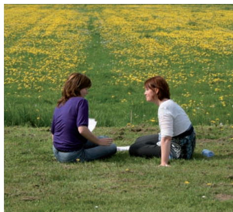
Praten over oplossingen creëert oplossingen