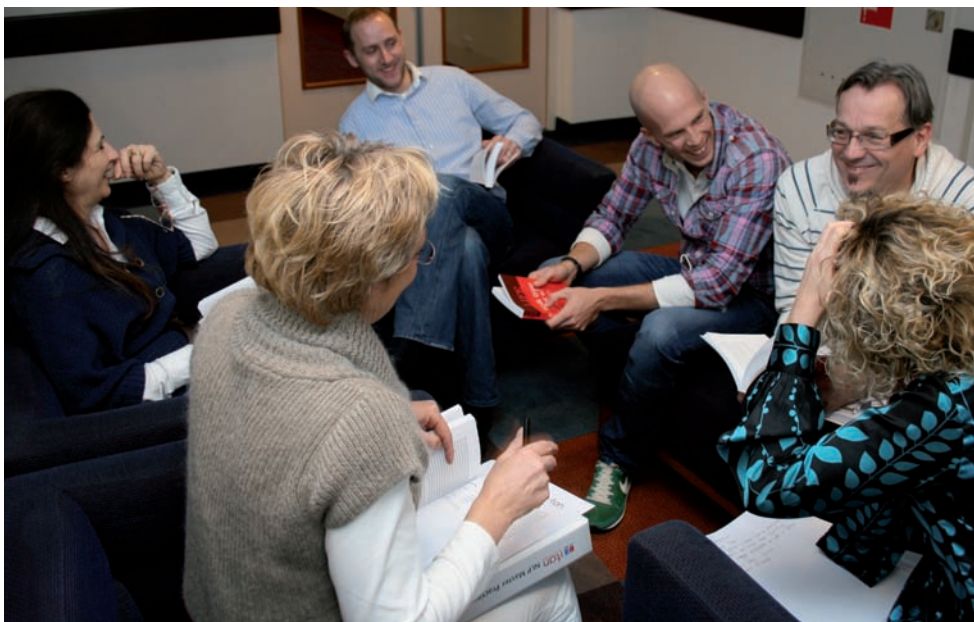
Met plezier samen werken aan groei

Ik vond het bijzonder om verschillende dynamieken te zien ontstaan in de opstellingen, bijna magisch. Het is haast niet te bevatten hoe groot de invloed van bepaalde omstandigheden op een systeem kan zijn. Op individuen, op gezinnen en families, soms generaties lang. Het was zo mooi om te mogen zien hoe oplossingen in beeld komen en zich tijdens een opstelling ontvouwen. Ook begrijp ik nu dat bijna iedereen uit loyaliteit wel iets draagt voor een ouder. Door die last symbolisch terug te geven krijg je weer